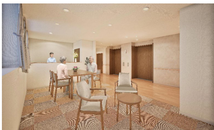
<リビング(談話スペース)>